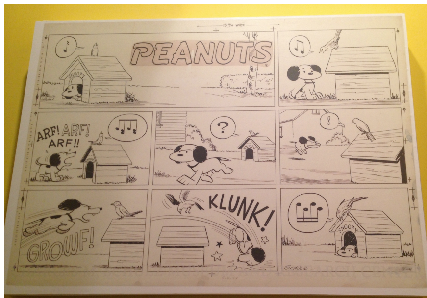
花生漫畫 - 周日版 1954.7.4